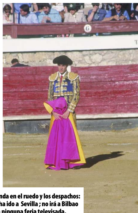
Manda en el ruedo y los despachos: no ha ido a Sevilla; no irá a Bilbao ni a ninguna feria televisada.